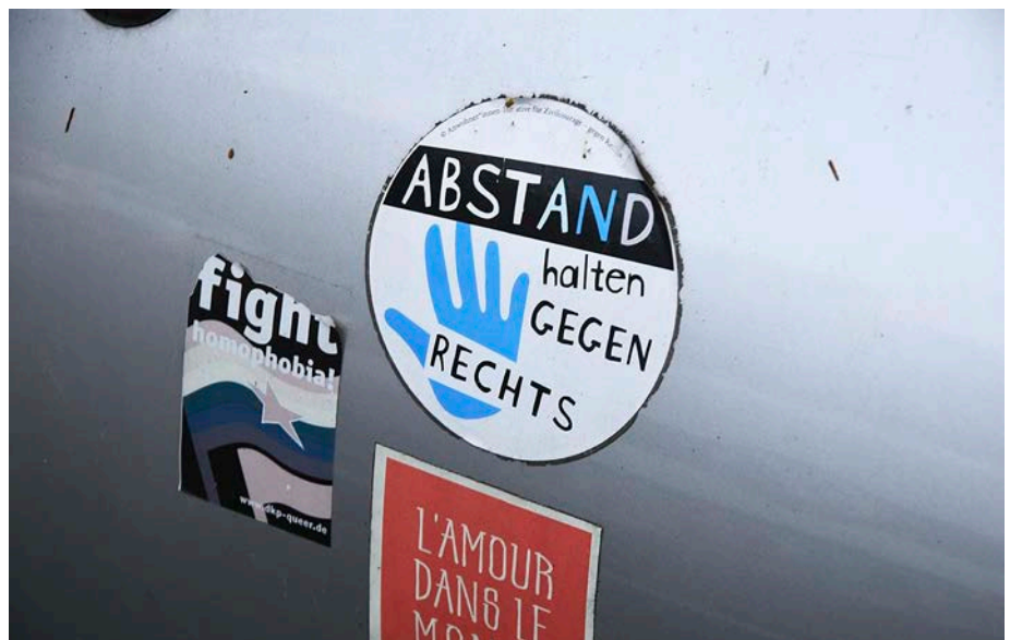
Passt irgendetwas nicht ins Narrativ, wird sofort und vollkommen unreflektiert die „Rechts!“-Keule ausgepackt.

In das eine oder andere darf man natürlich noch seine Nase stecken. Allerdings sind die Rechercheergebnisse reglementiert. Gewisse Rechercheergebnisse gehen heute einfach gar nicht mehr. Bei gewissen Fragen steht die Antwort, steht die „Wahrheit“ von vornherein fest. Das ist wie damals, als die allein seligmachende, heili-