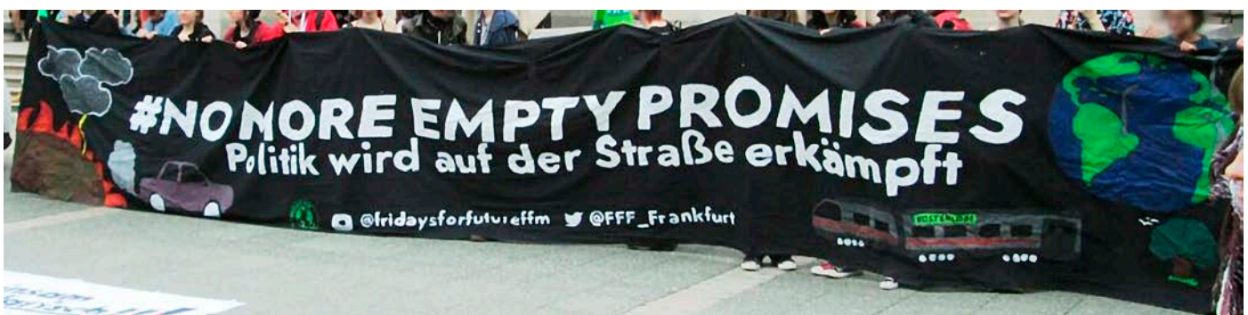
Klimastreik in Frankfurt/IM. am 31.05.2024