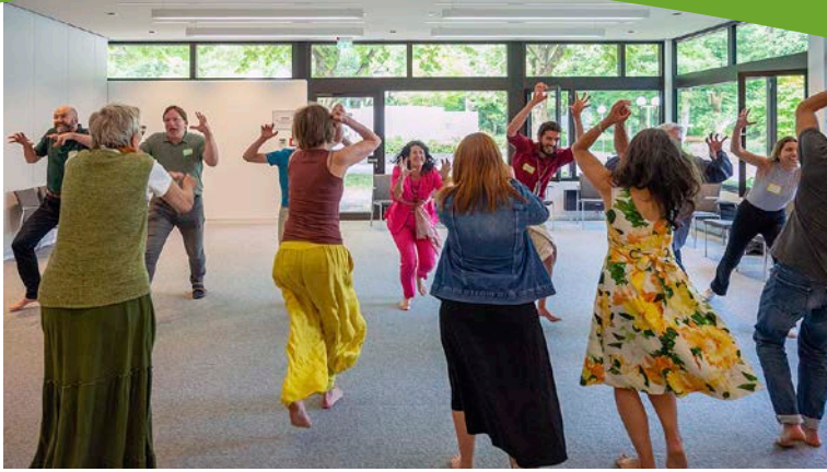
Aufwärmen im Vorbereitungsworkshop

Schlüsse, auch hinsichtlich struktureller Veränderungsmöglichkeiten unseres Geldsystems.