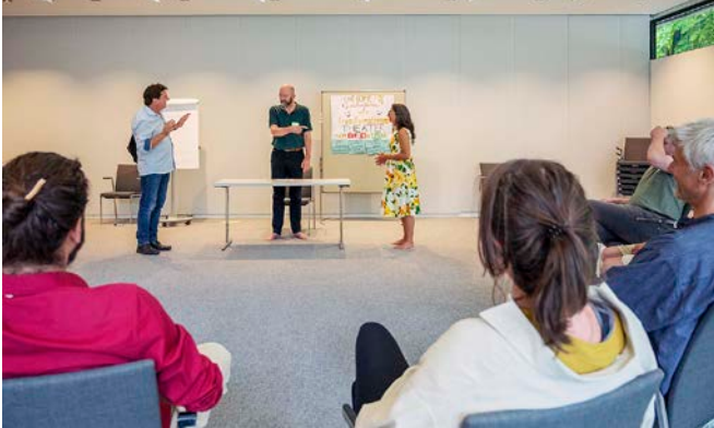
Im Forumtheater greift eine Zuschauerin aus dem Publikum mit ihrer Handlungsalternative aktiv in die Konfliktszene ein

nen. Diejenigen, die das Forumtheater anleiten, können dafür sorgen, dass die im Spiel gefundenen Änderungspotenziale schriftlich dokumentiert werden. Im besten Fall lassen sich daraus Gesetzesänderungen bzw. -verordnungen entwickeln oder Geschäftsmodelle von Unternehmen verändern. Politisch erfolgreich war dieses Konzept bereits mehrfach, wie bspw. bei der Vorbereitung des Tiroler Teilhabegesetzes von 2017 [2] . Hier konnten Entscheider:innen für bestehende ungerechte Verhältnisse sensibilisiert und durch das Theaterspiel betroffen gemacht werden. Sie haben offenbar erkannt, welche die notwendigen Impulse sind, die zu einer besseren Gesetzgebung führen und ggf. auch Ver-