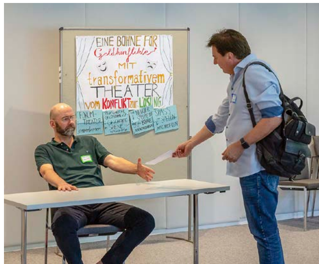
Im Vorbereitungsworkshop verwandelt sich eine erlebte Erzählung um einen geldbezogenen Vater-Sohn-Konflikt in eine Spielszene

gesammelt, die perspektivisch zu grundlegenden Veränderungen der Verhältnisse führen können. Kann also das Forumtheater gar ein Motor für Veränderungsprozesse sein?