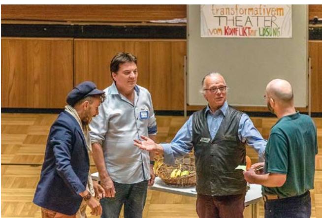
Eine Spielszene aus der Abendveranstaltung: Dieser Geldkonflikt steht kurz vor der Auflösung

Kulturwissenschaften zu machen. 2020 schloss sie die Ausbildung zur Theaterpädagogin BuT® an der Theaterwerkstatt Heidelberg ab und arbeitet seitdem an der Medizinischen Fakultät der Universität Augsburg als Ausbilderin für Simulationspatient:innen sowie in Nebentätigkeit in mehreren theaterpädagogischen und künstlerischen Projekten.