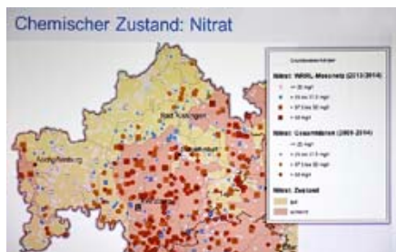
In vielen Regionen Deutschlands wird der Nitrat-Grenzwert überschritten.

ische Nitratrichtlinie in nationales Recht umsetzen soll. Der Bundesrat stimmte der Reform am 10. März zu.