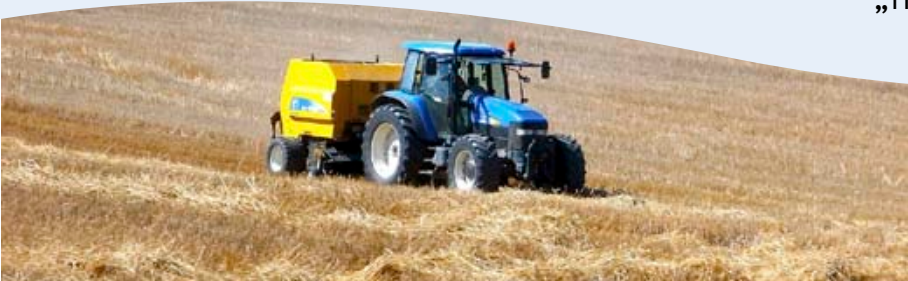
Gemeinsam mit Bauern will „Aktion Agrar“ die Landwende voranbringen.

triebe nimmt rapide ab. Ein überschaubares Beispiel gibt der Landkreis Tübingen. 5.874 Betriebe wurden dort 1960 registriert. 1997 war noch ein Fünftel übrig, nämlich genau 1.113. Zehn Jahre später existierten von den Höfen gerade einmal 654. Auch davon starb in der Folge ein Drittel. 2010 war man bei 419 Höfen angelangt.