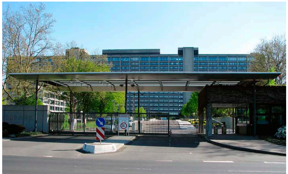
Haupteingang & Gebäude Deutsche Bundesbank, Frankfurt am Main

Die Frage ist eben nur, ob die Theorie von Joseph Huber die Tatsachen richtig beschreibt, einfacher gesagt, ob sie stimmt? Damit komme ich zum letzten und entscheidenden Punkt, der sachlichen Kompetenz im Hinblick auf die Sache selbst, also das Geld. Würden nur