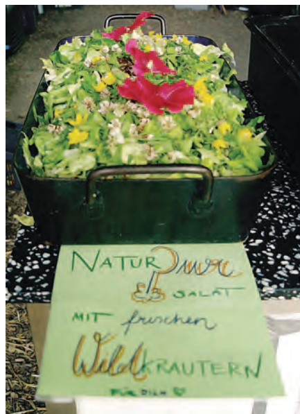
Natur-Pur-Salat. Ein Augen- und Gaumenschmaus.

„Jeder gibt, was er kann und am Ende haben alle alles.“