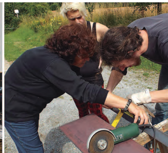
Arbeiten an der Lehmziegelpresse – Alles wird aus Stahl geflext, geschraubt und verschweißt.