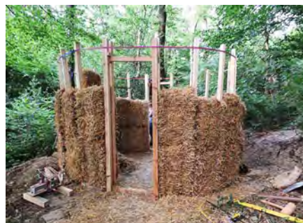
Die Rotunde wird mit Strohballen ausgekleidet.

herum schüttelt wie eh und je der Wald fröhlich und unbekümmert seine Blätter, jetzt allerdings auch auf das Mandala-Dach einer kleinen Strohballen-Rotunde und auf eine fast fertige Lehmziegelpresse. Über das Gelände wuseln vereinzelt Menschen im Alter