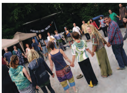
Kreise schließen sich – gemeinsam Hand in Hand.