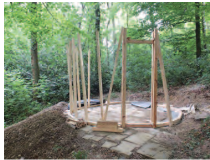
Das Gerüst der Rotunde entsteht.