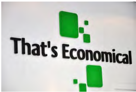
Ist wirtschaftlich tatsächlich nur das, was an den Hochschulen gelehrt wird?